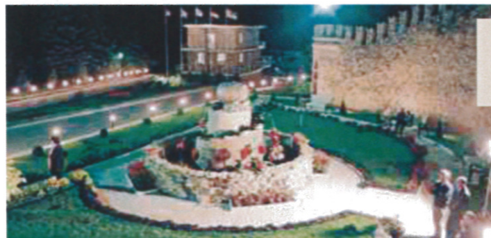
UN PATRIMOINE À DÉCOUVRIR et des affaires à faire.

société se propose de faire découvrir, éventuellement en vue de partenariats ou d'investissements dans le pays. Beten international a notamment participé à de nombreux projets dans la produc-